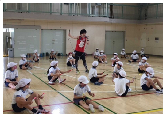
ヒジキさんの縄跳び教室の様子