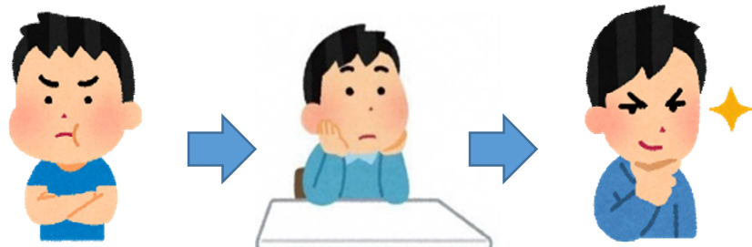
前よりもっとよくなりたい！それが「自己ベスト」をめざす子

さあ、今日も小さな「自己ベスト」をめざして一日を頑張っていきましょう。自己ベストをめざす江古田の子どもたちへの応援と賞賛の声掛けをお願いいたします。