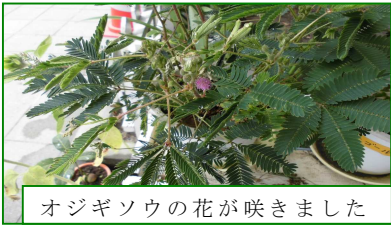
オジギソウの花が咲きました

学校の教育目標◎かんがえる子ども○やさしい子ども○たくましい子ども(◎重点目標) 目指す学校の姿「元気いっぱい、笑顔で挑戦、子ども一人ひとりがよさを発揮できる学校」